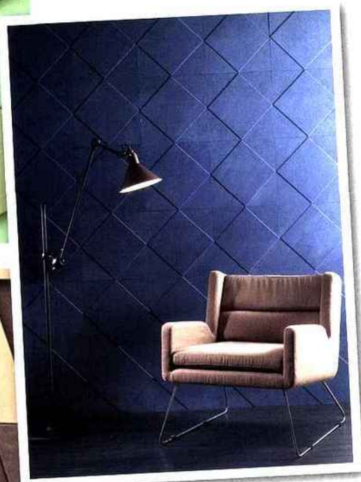
Collection Géométrie Variable, motif Losange.