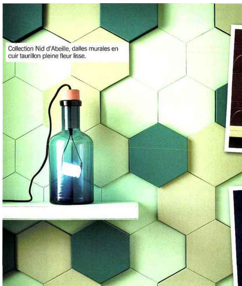
Collection Nid d'Abeille, dalles murales en cuir taurillon pleine fleur lisse.