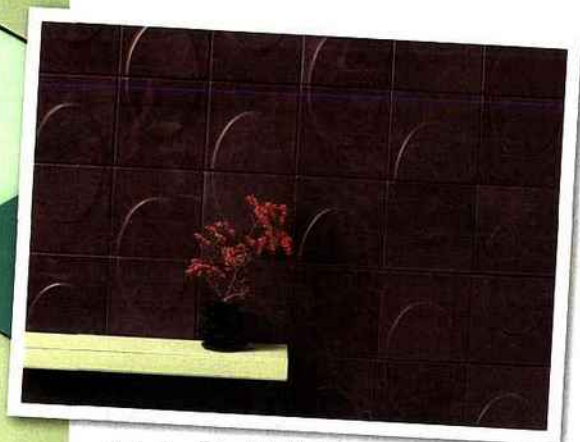
Collection Géométrie Variable, motif Arche.