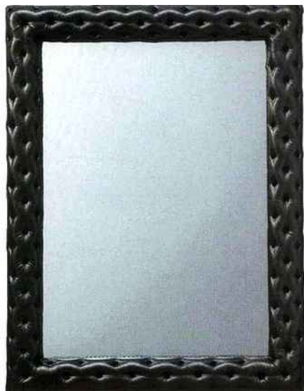
Mise en Demeure Miroir Rivoli en cuir capitonné argent. H. 130 x L. 100 x P. 9cm Ne lui demandez pas qui est la plus belle, il vous a volé la vedette !